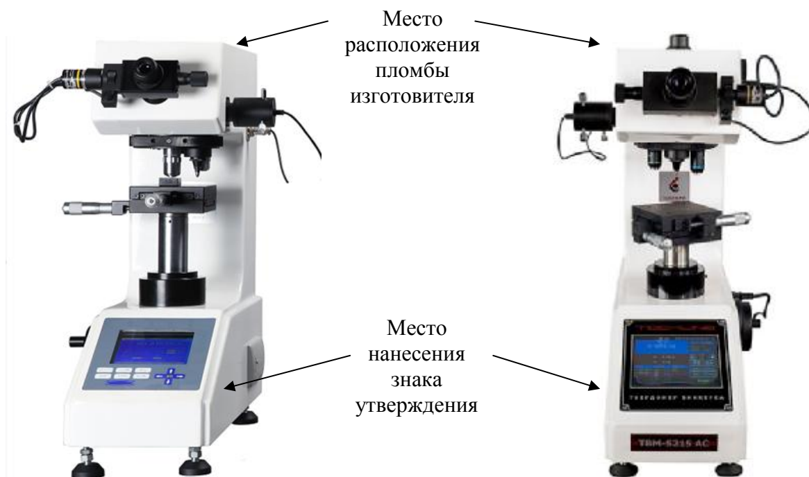
Рисунок 3 – Общий вид микротвердомеров TBM 5215C Tochline